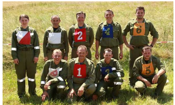
AFLB in Pregarten am 02.07.2016