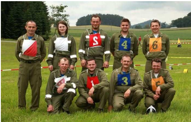
AFLB in Zeiss am 11.06.2016