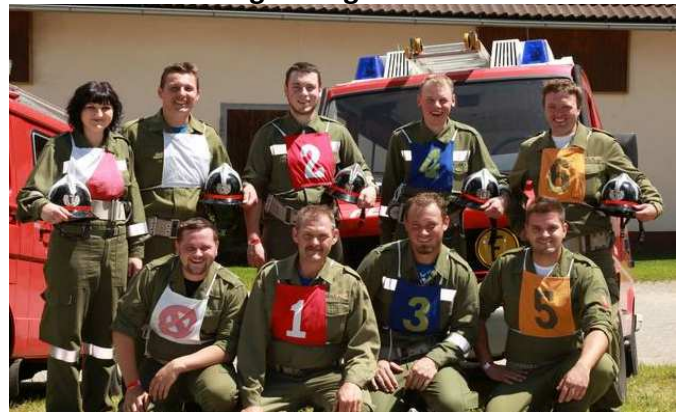
AFLB in Langfierling am 18.06.2016