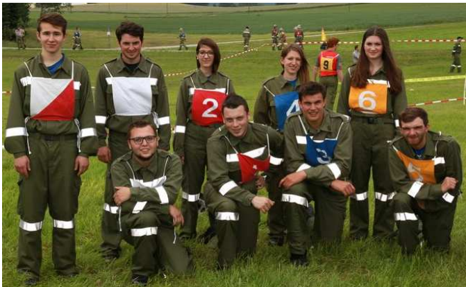
AFLB in Zeiss am 11.06.2016