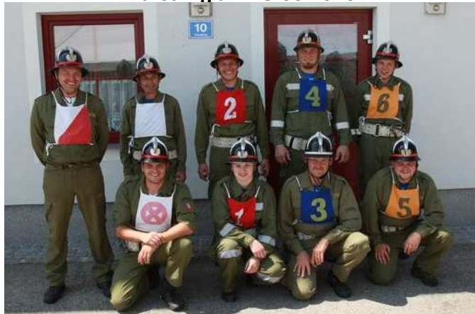
AFLB in Pürstling am 25.06.2016