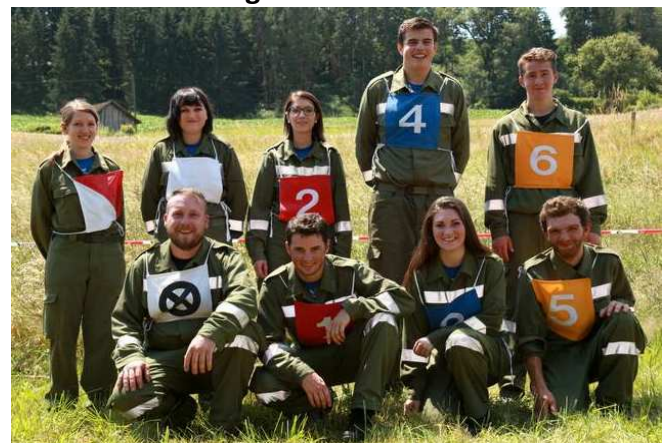
AFLB in Pregarten am 02.07.2016