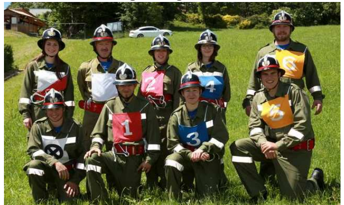
AFLB in Langfierling am 18.06.2016