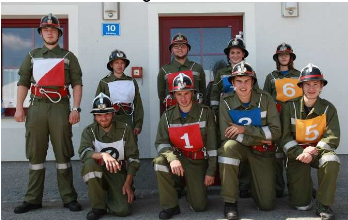
AFLB in Pürstling am 25.06.2016