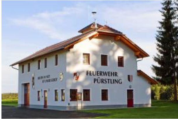
das neue Feuerwehrhaus

Nach 2 Jahren Bauzeit konnte das Projekt „Feuerwehrhauserweiterung“ erfolgreich abgeschlossen werden und im Sommer 2008 mit einem großen Fest eröffnet werden.