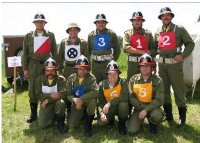
Bewerbsgruppe II nur in Pürstling in der Wertung Bronze angetreten