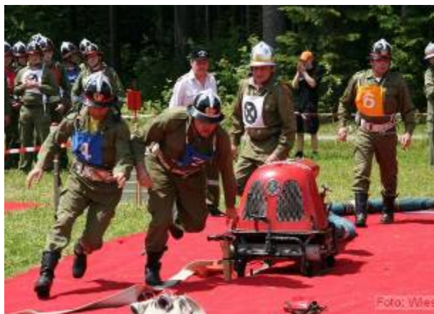
Gruppe Pürstling beim Bewerb

Nach der Siegerehrung stand dann ein Abend für die jungen auf dem Programm, wobei die Musikgruppe B.O.M das Zelt fast zum beben brachte.