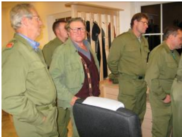
Auch die „ältere“ Generation war begeistert