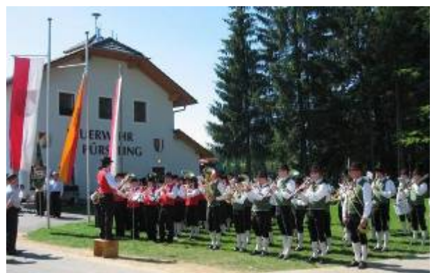
Gemeinsames Spiel der Musikkapellen Sandl und Grünbach beim Festakt