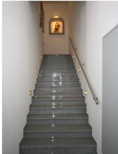
und so geht's zum Obergeschoss