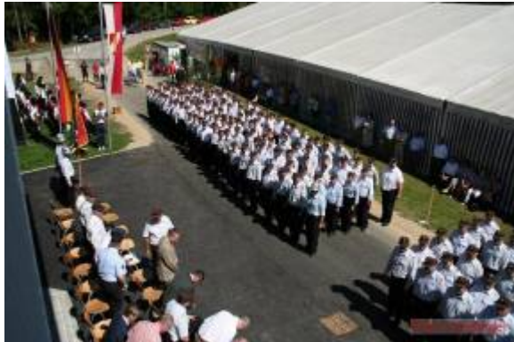
beeindruckend die Feuerwehren beim Festakt