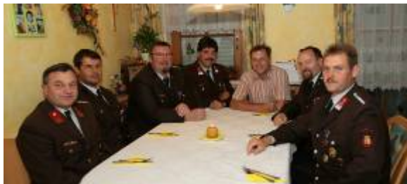
das Kommando gratulierte unserem „Vize“