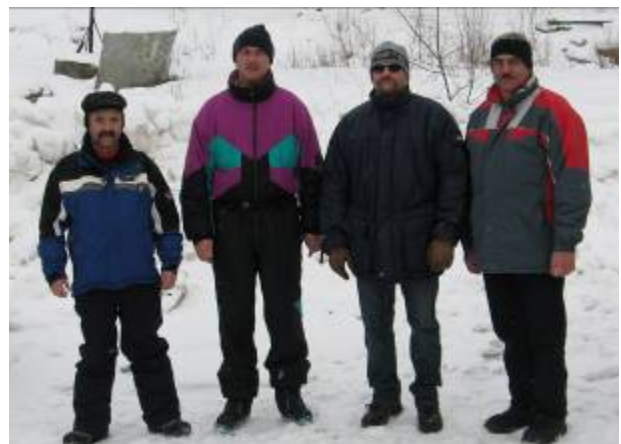
Die Sieger 2008