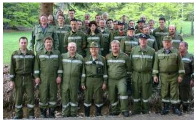
Gemeinschaftsübung in Sandl