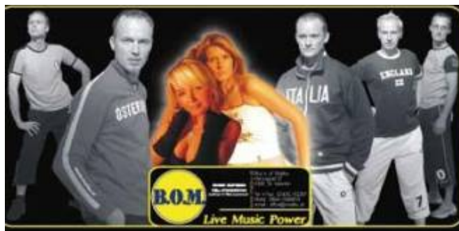
die Gruppe B.O.M