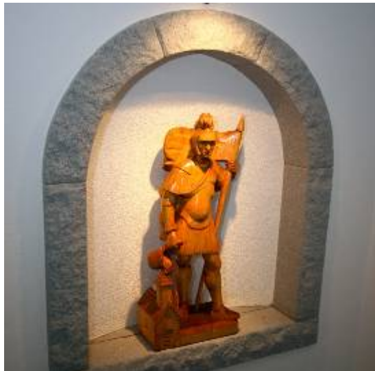
auch der Hl. Florian von Adi Bauer fand wieder einen Ehrenplatz

64 Kameraden waren in den 2 Jahren am Bau in den verschiedenen Berufsparten mit Werkzeug und „Know How“ beteiligt und halfen so auch einiges einzusparen.