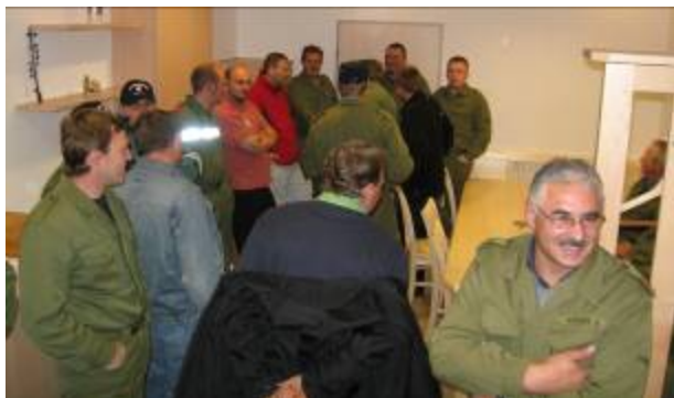
Reges Interesse im neuen Feuerwehrhaus