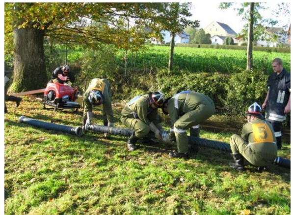
die Gruppe beim kuppeln der Saugleitung